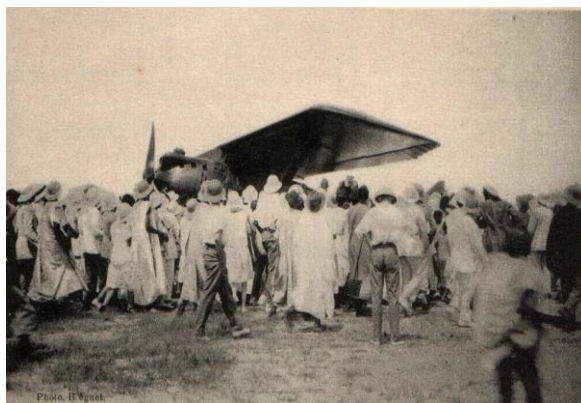
Arrivée à St Louis du Sénégal : 11 octobre 1927

Il fait bon. Deux jours de mauvais temps ont retardé notre traversée, mais nous n'avons plus qu'un but, qu'une volonté : passer. Après une dernière dérive sur la terre ferme, un dernier coup d'œil sur Dakar et la presqu'île du Cap Vert, nous grimpons à 2000 mètres. Le moteur ronfle de façon rassurante. Dessous, la mer est complètement calme. Nous utilisons les quelques cumulus rencontrés pour calculer notre dérive et à intervalles irréguliers, nous échangeons nos impressions sur l'océan par le moyen d'une feuille de bloc-notes, transmise par un trou réservé dans la cloison qui nous sépare. Vers 19h des « moutons » sur la mer nous signalent un grain très probable, puis, soudain, une haute barrière de nuages sombres se dresse. Le « pot au noir » comme disent les marins. La pluie redouble, l'obscurité devient de plus en plus épaisse. Pendant 45mn nous montons... Ouf ! Un halo solaire et puis l'air libre. Nous sommes à 3700 mètres en plein au-dessus du « pot au noir », et aux deux tiers du trajet. 22h30 : ligne 00.00° de latitude. Nous passons de l'automne ...au printemps. 1h35 : Costes griffonne: « regarde ! Je crois que c'est l'Amérique ». Pour la première fois l'atlantique central est franchi après 17h au-dessus de la mer, avec l'eau pour plancher. Les habitants de Natal sont tout ébahis de voir cette machine qui vient de rallier Paris au Brésil en deux bonds.