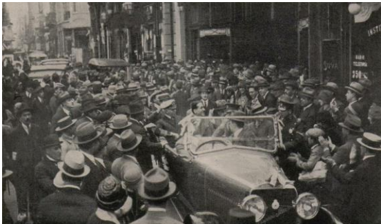
L'arrivée à Mexico

Colon - Guatemala. Guatemala - Mexico (Mexique).