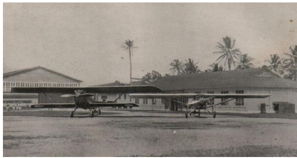
Rencontre à Panama entre le « Nungesser-Coli » et le « Spirit of St Louis » de Lindbergh

Buenos aires - Santiago (Chili). Santiago - La Paz (Bolivie). La Paz - Lima (Pérou). Lima - Guayaquil (Equateur). Guayaquil - Colon (Panama). Colon - Caracas (Venezuela). Caracas – Barranquilla (Colombie). et retour Barranquilla - Colon.