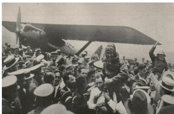
L'arrivée à Buenos aires

Natal - Caravellas (Brésil). Caravellas - Rio de Janeiro (Brésil). Rio de Janeiro - Pelotas (Brésil). Pelotas - Buenos Aires en survolant l'Uruguay. Buenos Aires - Montevideo (Uruguay) et retour. Buenos Aires - Asunción (Paraguay) et retour. Buenos Aires - Florianópolis (Brésil). Florianópolis - Rio de Janeiro. Rio de Janeiro - Buenos Aires.