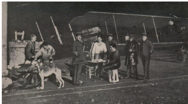
Repas à Alep avant le retour à Paris

Tokyo (Japon) - Hanoi (Cochinchine) via Kouang Tchaou Hanoi – Bassorah (Arabie) via Calcutta (Inde), Jodhpur (Inde), Karachi (Perse). Bassorah – Paris via Deir-Es-Zor (Arabie), Alep (Syrie), Athènes (Grèce) et Marseille.