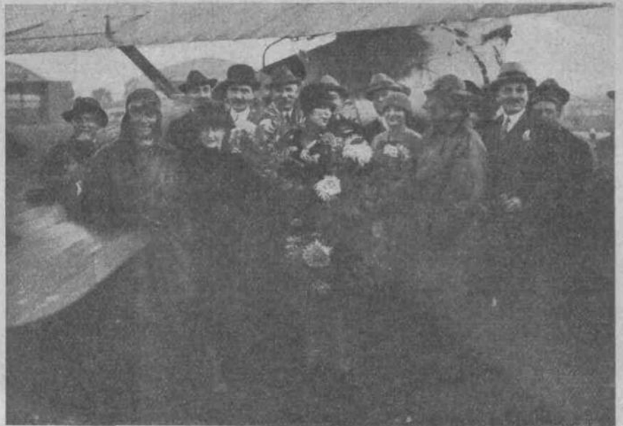
LES AVIATEURS APRÈS LEUR ATERRISSAGE

Ensuite ce fut l'étape de Calcutta, point extrême du voyage et point de départ de celui du retour. Successivement les aviateurs firent les parcours suivants : Calcutta-Delhi, 1.900 kilomètres ; Delhi-Karachi, 1.450 kilomètres ; Karachi-Bassora, 1.950 kilomètres ; Bassora-Alep, 1.400 kilomètres, voyage exécuté cons-