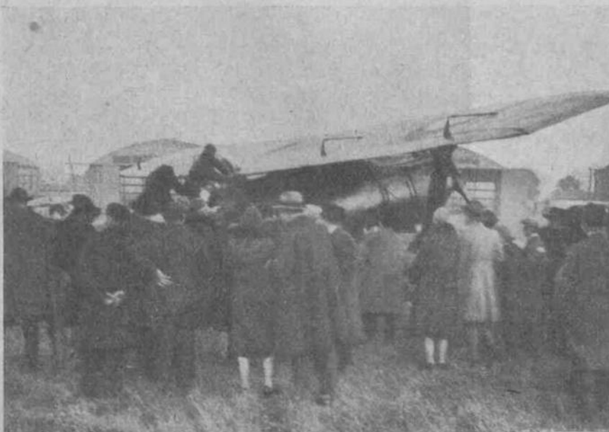
VUE GÉNÉRALE A L'ATERRISSAGE

Le Dahomey possède de riches terrains qui conviennent parfaitement au cacaoyer dont la culture est assez délicate et demande de grands soins pendant cinq ans, époque à laquelle l'arbre commence seulement à produire. C'est la principale raison qui fait que l'indigène ne s'occupe pas d'une façon suivie d'une culture dont il ne peut tirer immédiatement bénéfice.